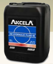
Akcela AW Hydraulic Fluid 46