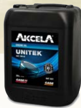
Akcela Unitek 10W40

AKCELA De smeermiddelen aanbevolen door CASE IH