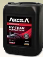
Akcela Hytran Ultraction