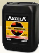
Akcela Engine Oil 15W40